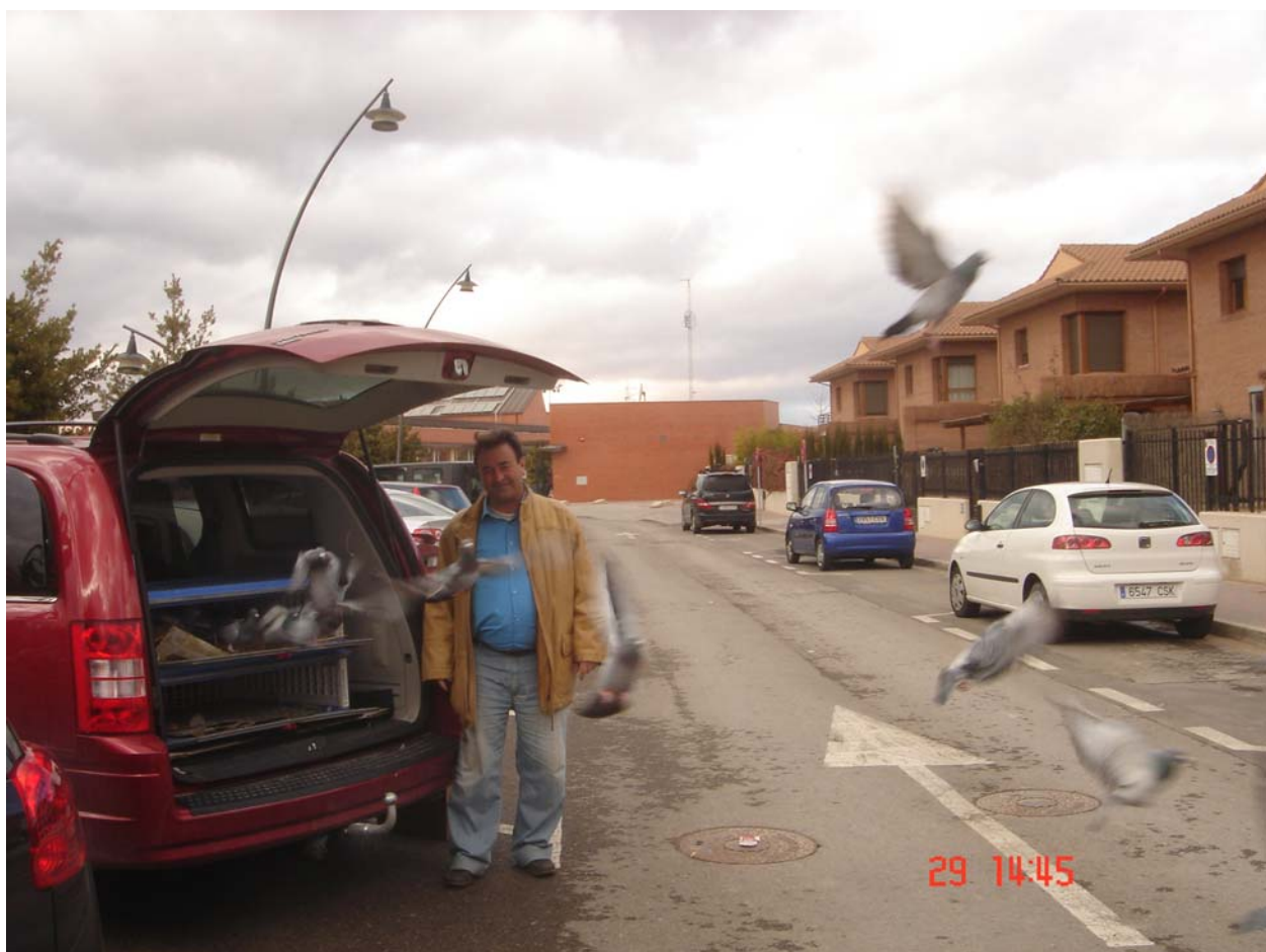
Un acto colombófilo no puede terminar sin una suelta de palomas.