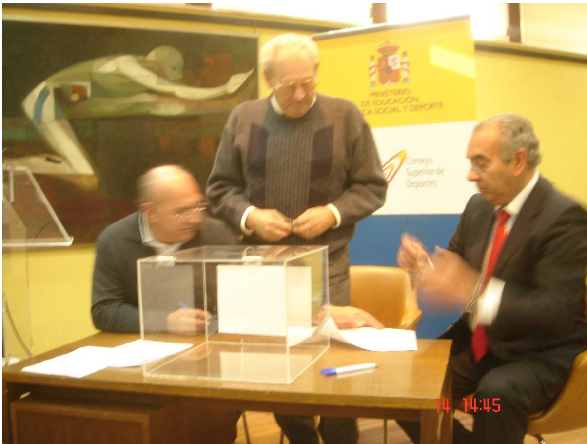
Una de las mesas electorales.