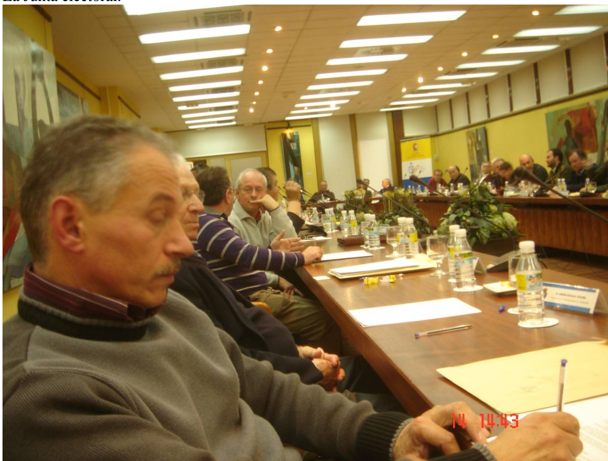
Salón de sesiones del Consejo Superior de deportes.