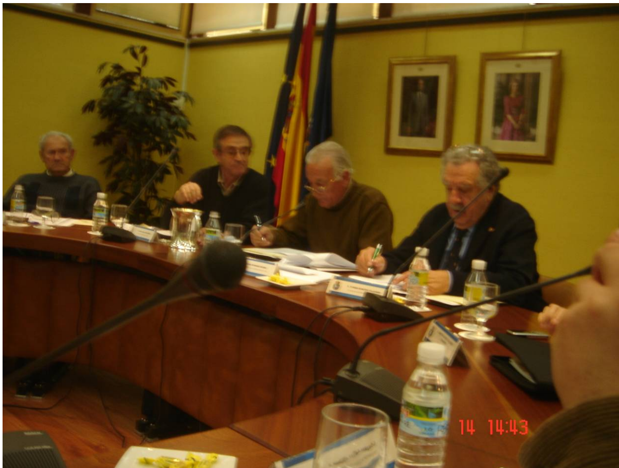
La Junta electoral.