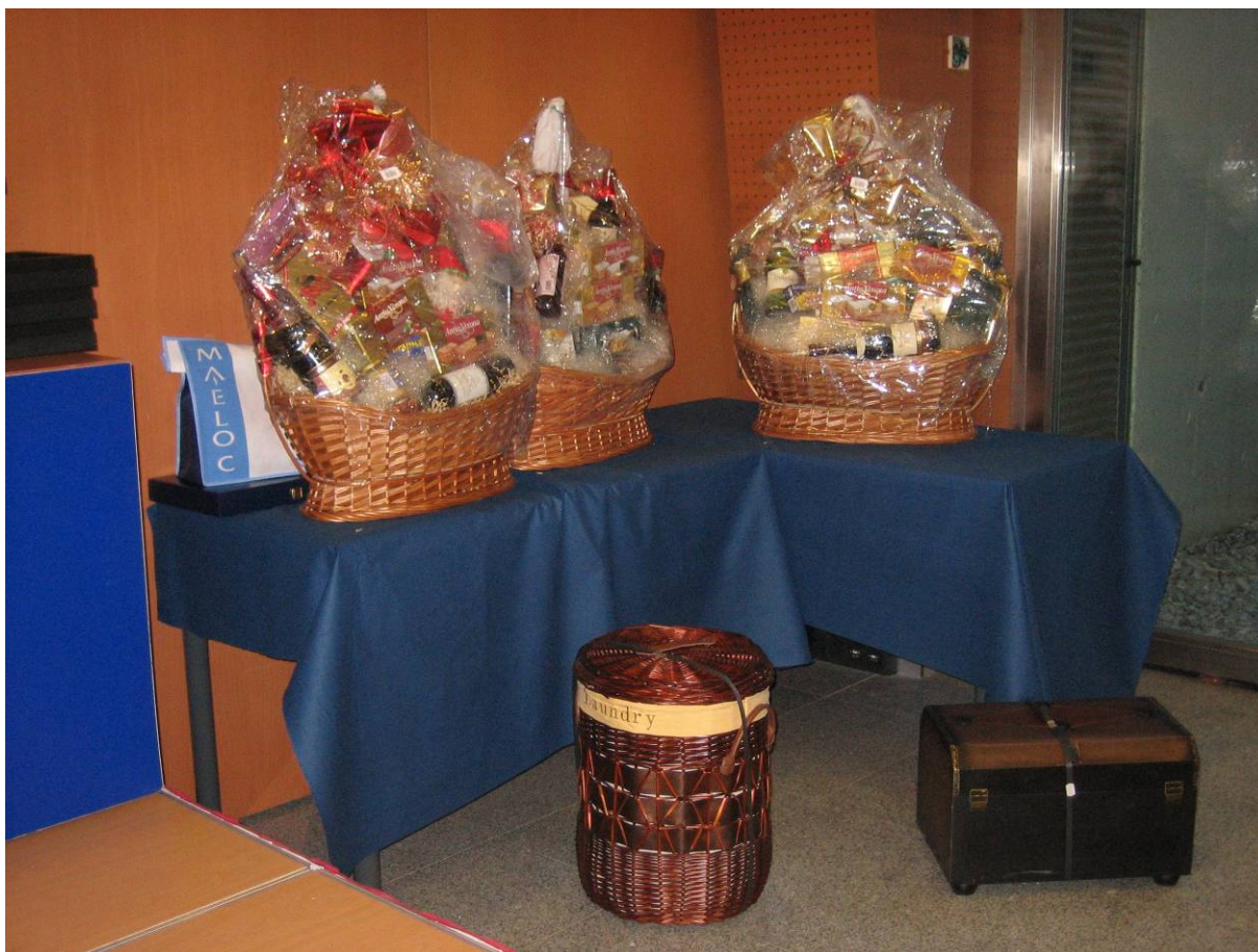
Un espectacular sorteo de regalos y palomas donadas por los campeones.